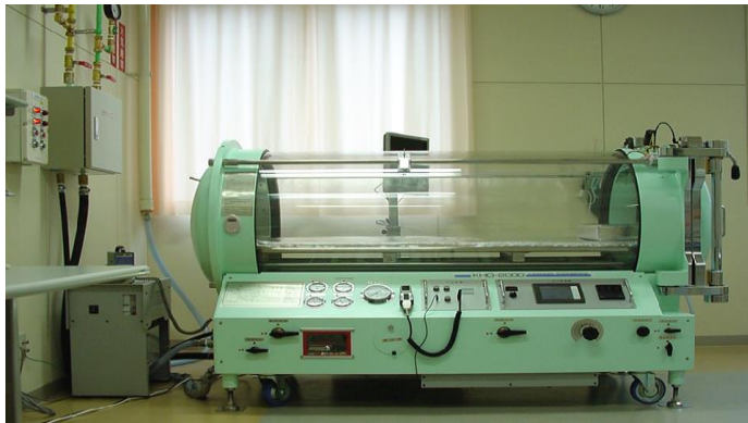
高気圧酸素治療装置 KHO-2000

当院では、第一種（1人用）治療装置を導入しており、酸素マスクを装着しての治療となります。